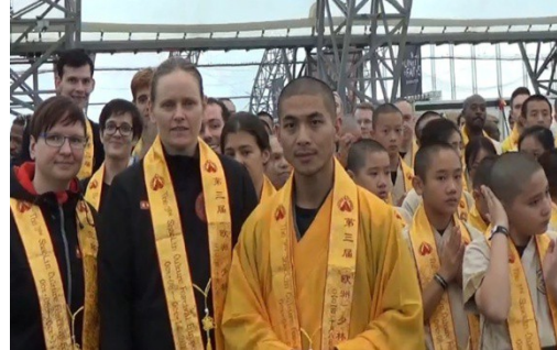
Shi Yan Xuan als Hauptschiedsrichter